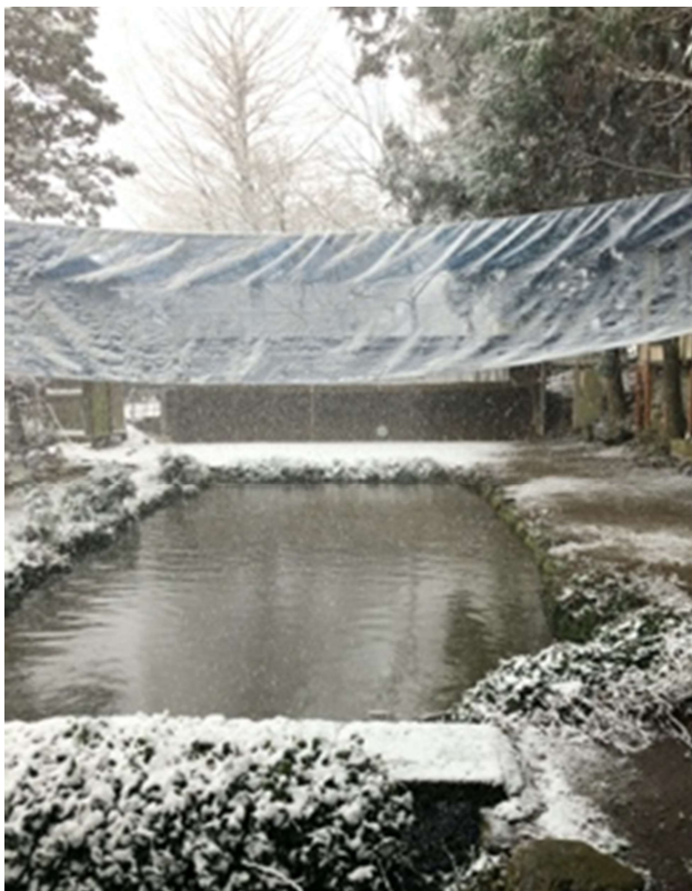
Dojo in Nagano