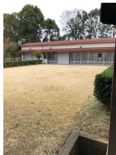
Dojo der Universität Tsukuba

Es gibt verschiedene Trainingstermine, welche auch immer an einer Tafel angeschrieben sind. Offizielles Training findet 3x pro Woche von 8:30 bis 12:30 statt. Dazu wird dann auch Hakama und Gi getragen. Beim offiziellen Training bekommt man ein Mato zugewiesen und das wird auch auf einer Tafel mit einer Plakette in Schriftzeichen dargestellt. Europäische Namen in Katakana. Die Zahl der Studierenden liegt maximal bei 30, zu meiner Zeit waren etwas weniger Studierende anwesend. Sie sind es auch, die bereits morgens um 7:30 das Dojo vorbereiten und abends um 18:30 wieder alles abbauen. Neben dem offiziellen Training gibt es auch freies Training, wo die Studierende nur die Aufgabe haben am Tag 20 Pfeile zu