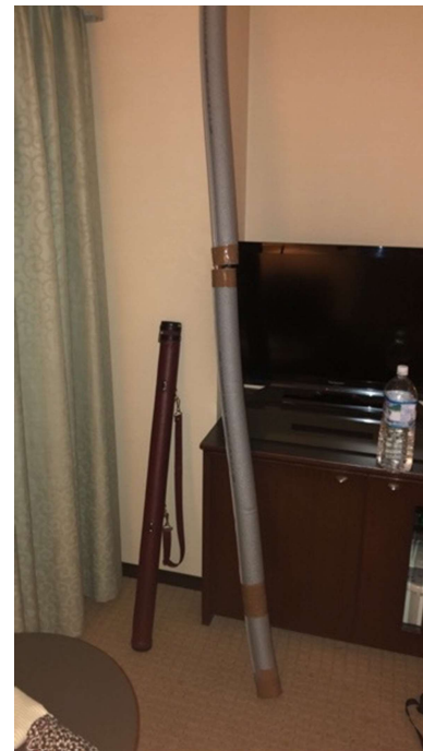
Transportverpackung – im mittleren Bild zu sehen: Passend für bis zu zwei Bögen nebeneinander